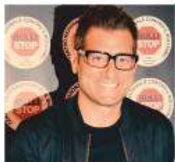
ENRICO PAPI AMBASCIATORE