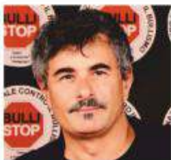
PAOLO GENOVESE AMBASCIATORE