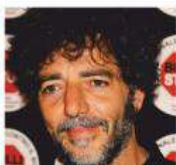
MAX GAZZÈ AMBASCIATORE