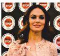
MARIA GRAZIA CUCINOTTA MADRINA