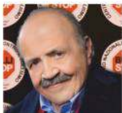
MAURIZIO COSTANZO PRESIDENTE ONORARIO