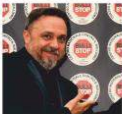
GABRIELE CIRILLI PORTAVOCE